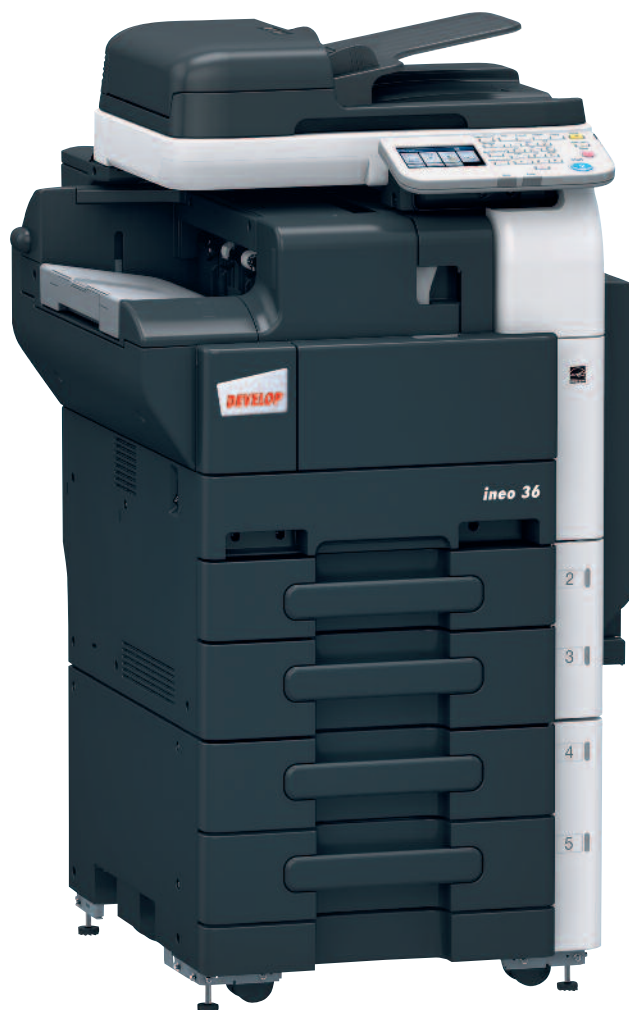
ineo 36 s integrovaným finišerem a přídatnou dvojicí kazet na papír (2 x 500 listů)

Díky standardní výbavě duplexním tiskem a duplexním podavačem originálů usnadňuje ineo 36 například automatické kopírování a pomáhá také šetřit papír. Jeho barevný dotykový displej umožňuje snadné ovládání a volitelný integrovaný finišer s rohovým a 2-bodovým sešíváním dále zvyšuje uživatelský komfort.